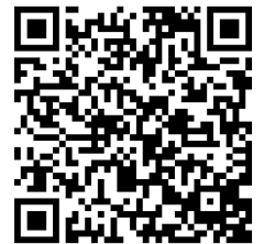
Anmelde- und Teilnahmebedingung

Für finanziell schwache Familien besteht die Möglichkeit einer Bezuschussung. Sprechen Sie gerne unsere Diakonin Wiebke Bruns an.